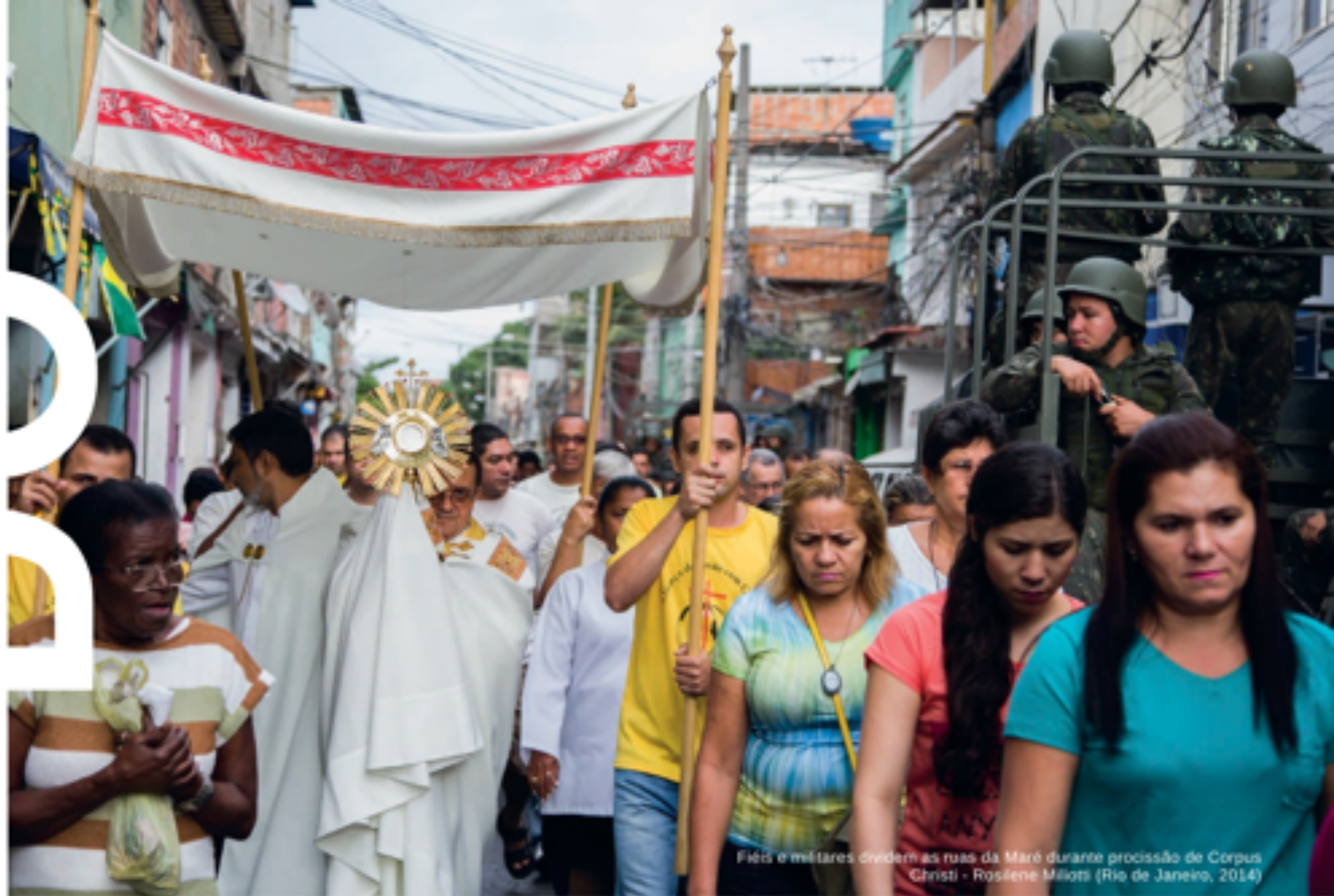
Fieis e militares dividem as ruas da Maré durante procissão de Corpus Christi - Rosilene Milioto (Rio de Janeiro, 2014)