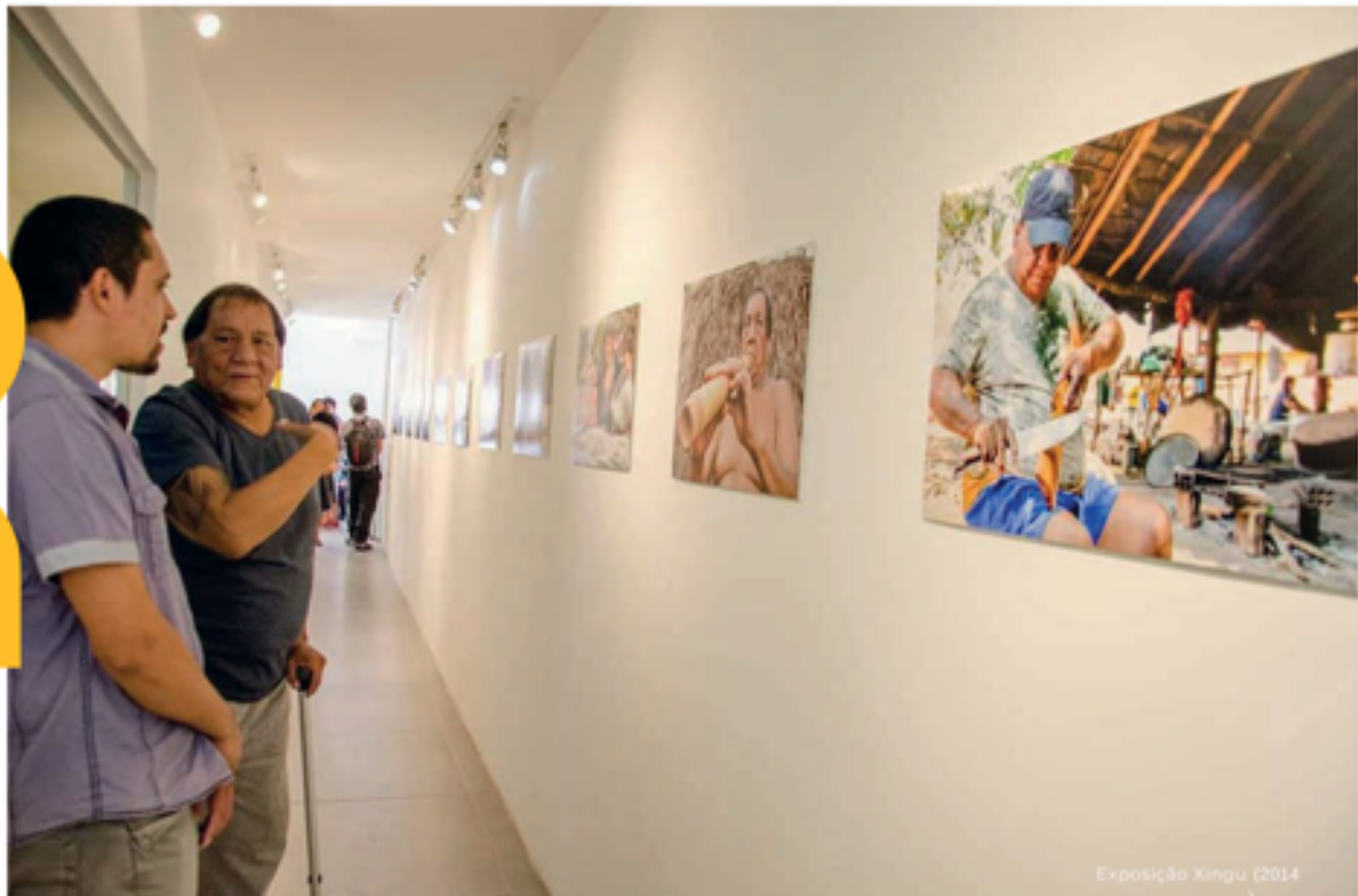
Exposição Xingu (2014)