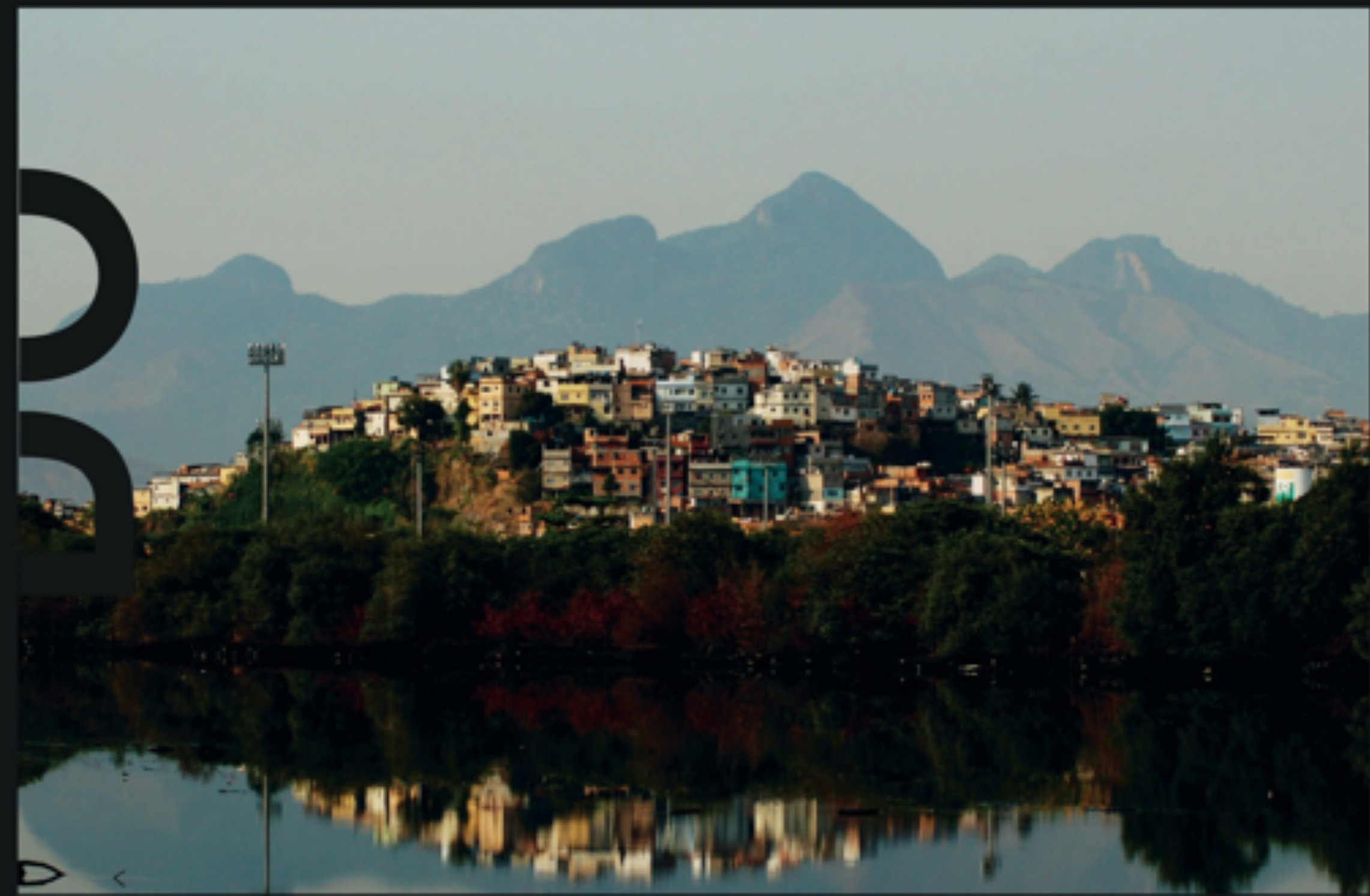
Morro do Timbau - Rosilene Milotti (Rio de Janeiro, 2007)