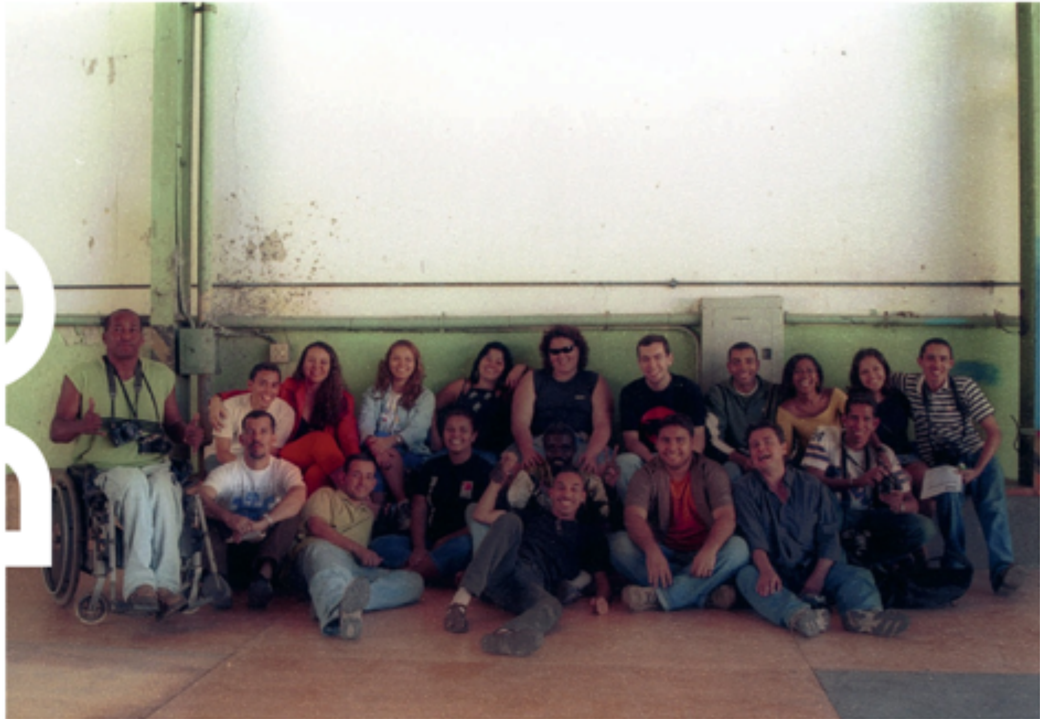
Primeira turma do Imagens do Povo - 2004