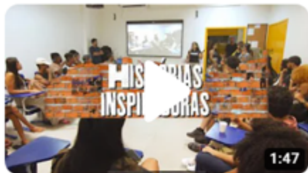
Histórias inspiradoras - Ep. 3 Vivências na Fotografia