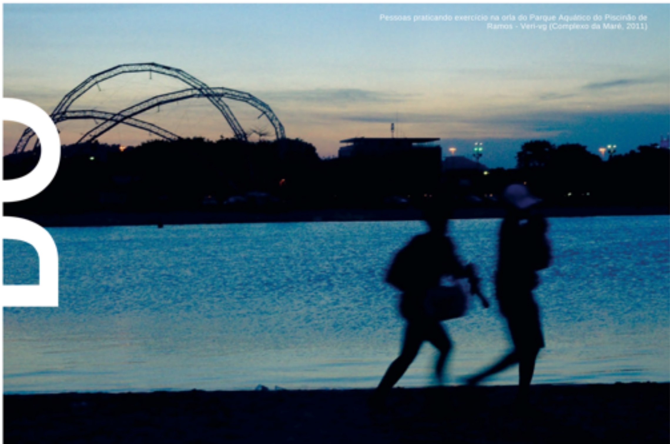
Pessoas praticando exercício na orla do Parque Aquático do Piscinão de Ramos - Veri-vg (Complexo da Maré, 2011)