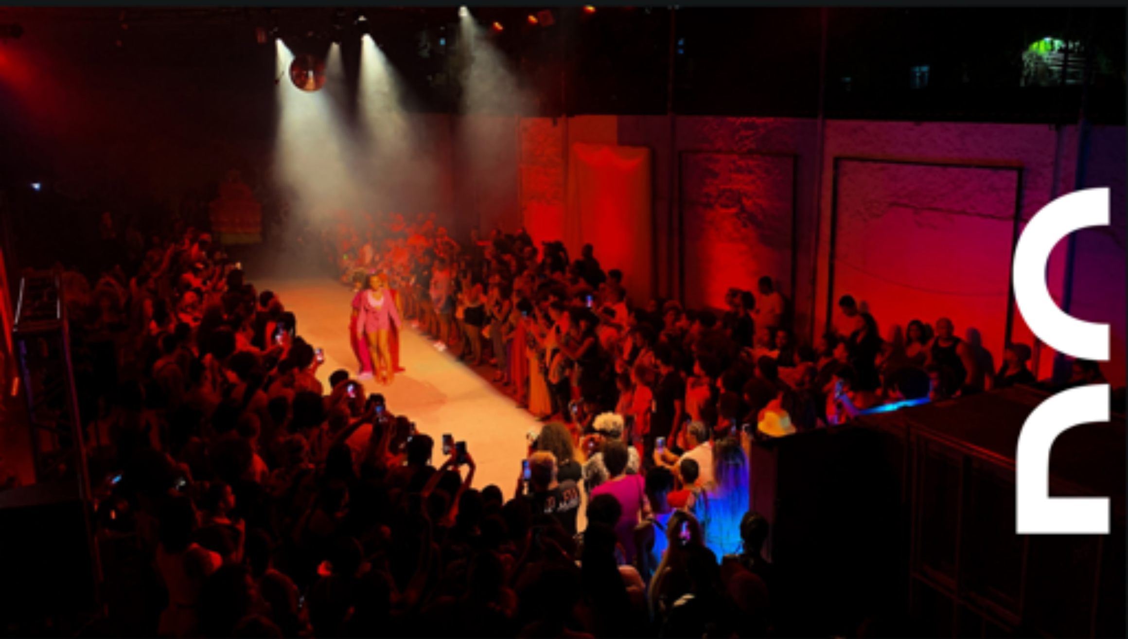
Espetáculo A Noite das Estrelas - Flávia Costa