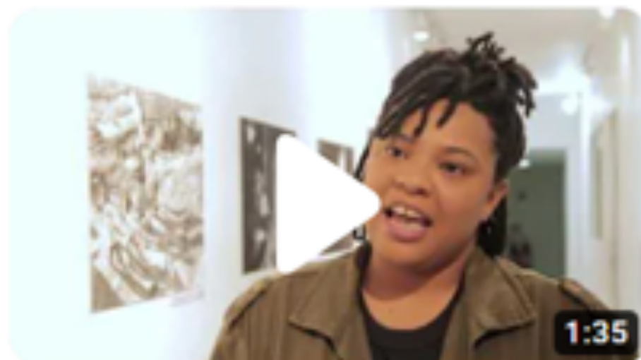
Imagens do Povo 2022