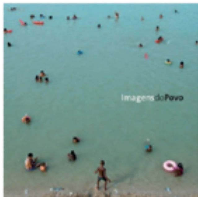
Imagens do Povo [organizadores e curadores João Roberto Ripper, Dante Gastaldoni, Joana Mazza]. - Rio de Janeiro: Nau Editora, 2012 (Financiado pelo Edital Artes Visuais 2011 - Governo do Estado do RJ)