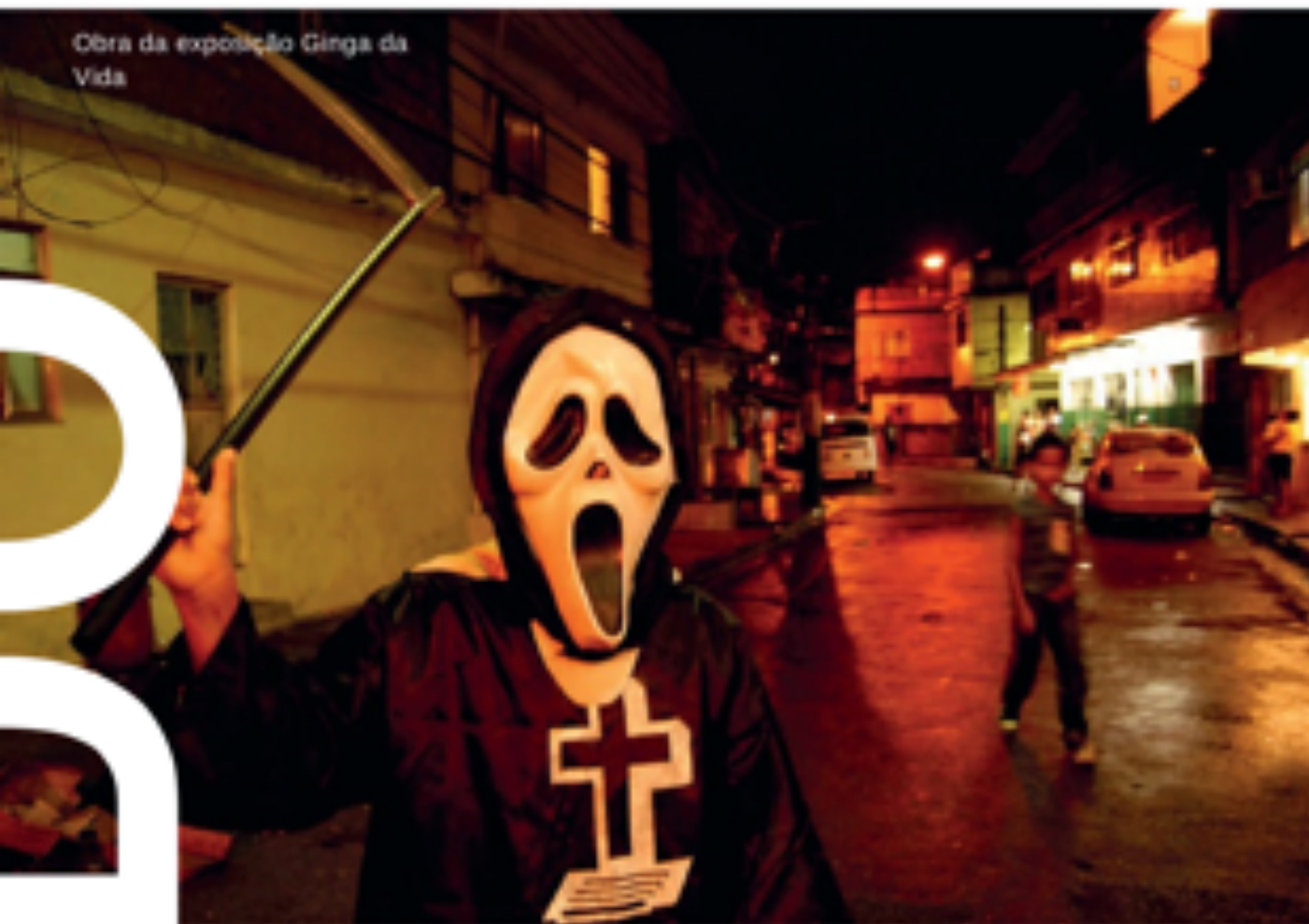
Obra da exposição Ginga da Vida