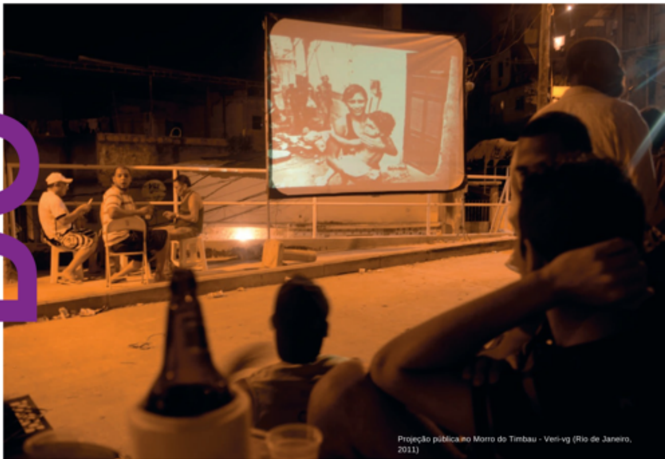
Projeção pública no Morro do Timbau - Veri-vg (Rio de Janeiro, 2011)